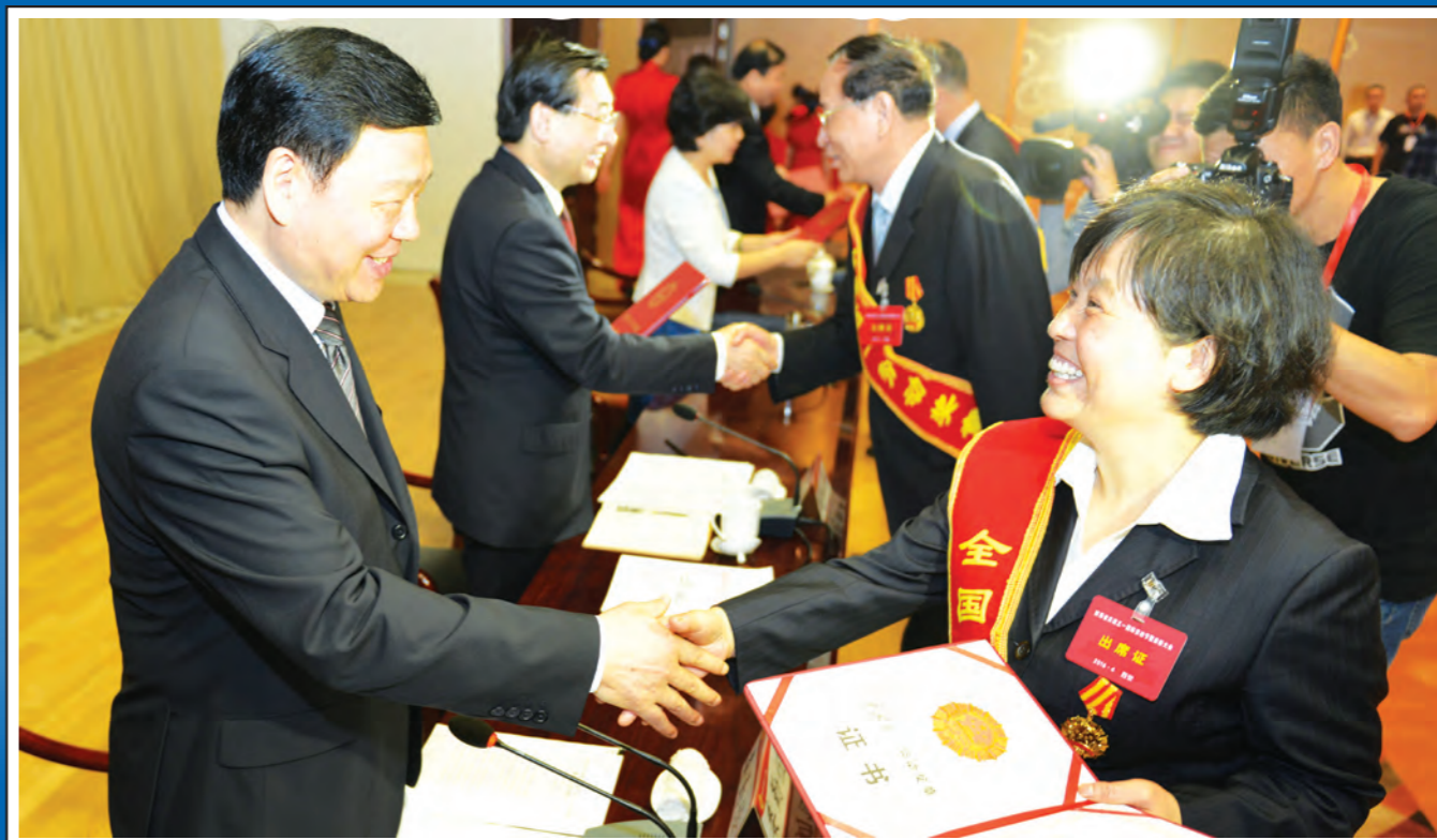
封面说明: 省委书记娄勤俭、省长胡和平等领导向在庆祝“五一”国际劳动节暨表彰大会上受到表彰的先进集体和个人颁发证书