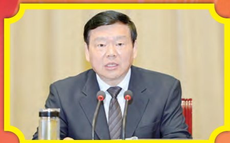
省委书记、省人大常委会主任娄勤俭讲话

4月29日，陕西省庆祝“五一”国际劳动节暨表彰大会在西安隆重召开。省委书记、省人大常委会主任娄勤俭，省委副书记、省长胡和平，省政协主席韩勇，省委常委、秘书长刘小燕，省人大常委会副主任李金柱，副省长姜锋出席会议，省总工会主席白阿莹主持会议。会议对2016年全国五一劳动奖状、奖章和工人先锋号及2016年陕西省五一劳动奖状、奖章和工人先锋号进行了表彰。娄勤俭书记发表重要讲话。