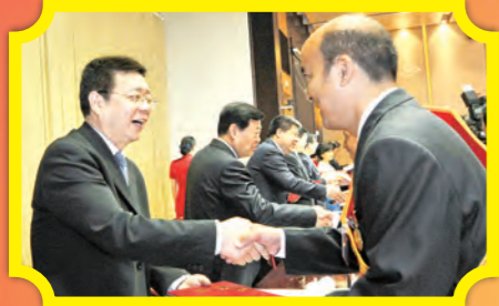
省总工会主席白阿莹为“五一劳动奖章”获得者颁发荣誉证书

4月29日，陕西省庆祝“五一”国际劳动节暨表彰大会在西安隆重召开。省委书记、省人大常委会主任娄勤俭，省委副书记、省长胡和平，省政协主席韩勇，省委常委、秘书长刘小燕，省人大常委会副主任李金柱，副省长姜锋出席会议，省总工会主席白阿莹主持会议。会议对2016年全国五一劳动奖状、奖章和工人先锋号及2016年陕西省五一劳动奖状、奖章和工人先锋号进行了表彰。娄勤俭书记发表重要讲话。