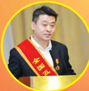
2016年“全国五一劳动奖章”获得者、中国科学院西安光机所副所长李学龙代表获奖个人发言