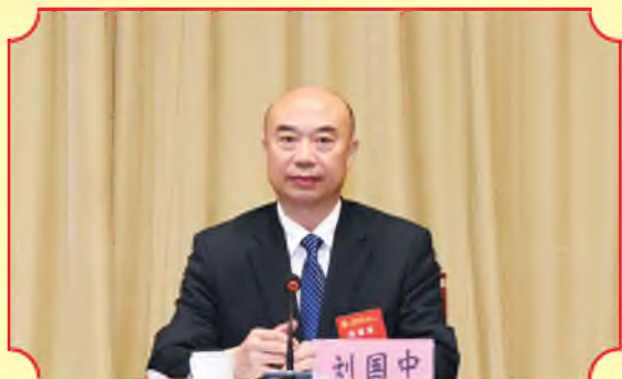
省长刘国中主持大会