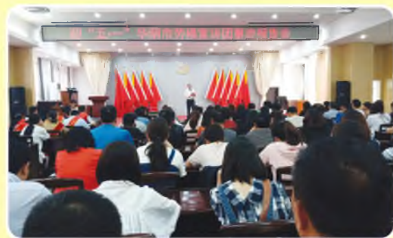
4月25日，华阴市总工会举办“迎五一”劳模宣讲团事迹报告会。