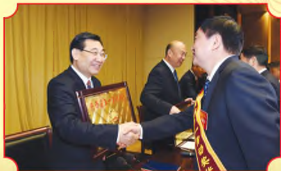
省委书记胡和平向受表彰代表颁奖