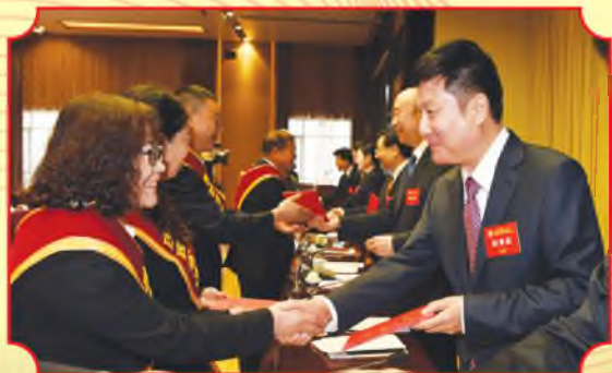
省人大常委会副主任、省总工会主席郭大为向受表彰代表颁奖