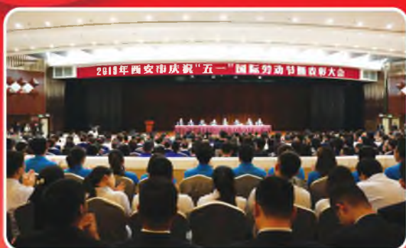
4月29日，西安市庆祝2019年“五一”国际劳动节暨表彰大会隆重召开，市委副书记、政法委书记韩松出席并讲话。