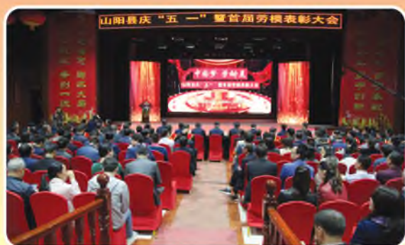
4月30日，山阳县举行首届劳动模范和先进工作者表彰大会。