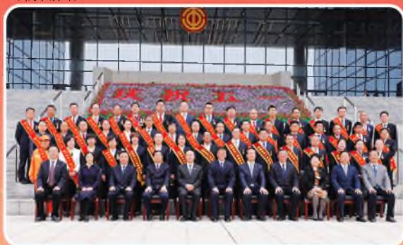
4月30日，铜川市召开庆祝“五一”国际劳动节暨首届“五一”劳动奖表彰大会，市委书记杨长亚出席并讲话。