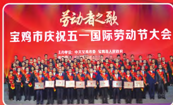
4月30日，宝鸡市2019年劳动者之歌暨庆祝“五一”国际劳动节大会隆重召开，市长惠进才出席大会并讲话。