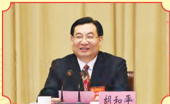
省委书记、省人大常委会主任胡和平出席会议并讲话