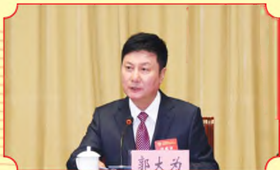
省人大常委会副主任、省总工会主席郭大为宣读《陕西省总工会关于表彰2019年陕西省五一劳动奖和陕西省工人先锋号的决定》