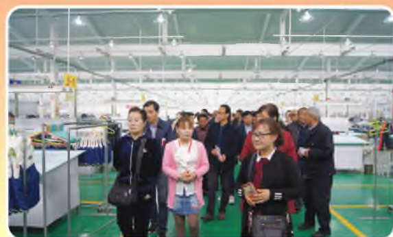
4月23日，扶风县总工会组织劳模代表开展“庆五一 弘扬劳模精神、劳模看扶风”观摩活动。