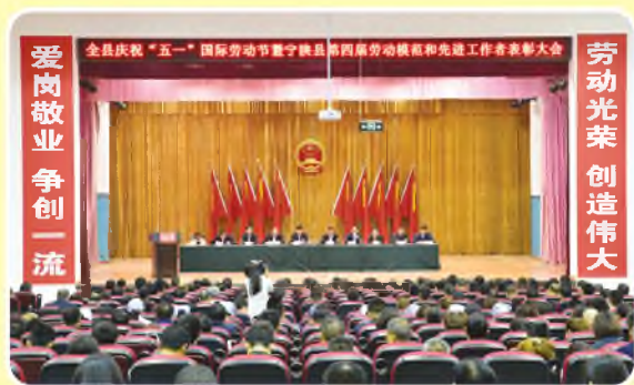
4月28日，宁陕县召开庆祝“五一”国际劳动节暨宁陕县第四届劳动模范和先进工作者表彰大会。