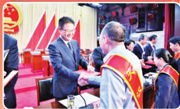
4月28日，汉中市召开2019年劳动模范暨天汉工匠表彰命名大会，市委书记王建军出席并讲话。