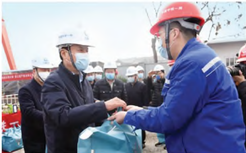
郭大为向中铁一局西安地铁9号线建设工地工人送慰问品

省人大常委会副主任、省总工会主席郭大为到中铁一局西安地铁9号线建设工地、清华德人西安幸福制药有限公司、西安纺织集团调研重点项目建设和企业复工复产工作,看望慰问一线建设者和广大职工。省总工会常务副主席张仲茜一同调研。