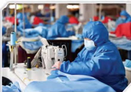
工人在隔离服生产线上工作

为缓解疫情防控物资紧缺状况,陕西金翼服装有限责任公司在政府相关部门的帮助下积极调整产能,通过快速筹备,将职业装生产线转变为防疫工作需要的隔离服生产线,开足马力保障防疫物资供应。