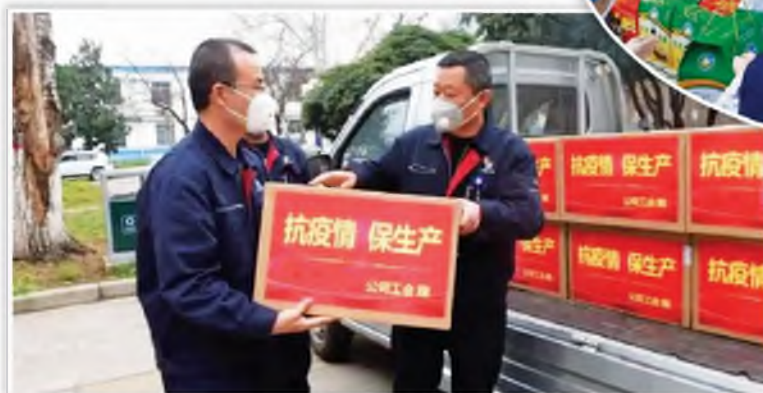
航空工业庆安工会为工人 发放防护用品