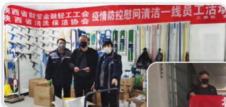
省财贸金融轻工工会协同清 洗保洁协会慰问清洁一线员工