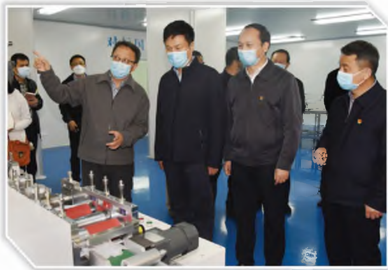
郭大为在陕药集团调研

份有限公司,郭大为深入生产线了解复工复产和职工生活保障情况,强调要把复工复产后的各项防控措施落细落小落实,把职工稳定好,把职工的生活安排好,确保“不出事”“不误事”。