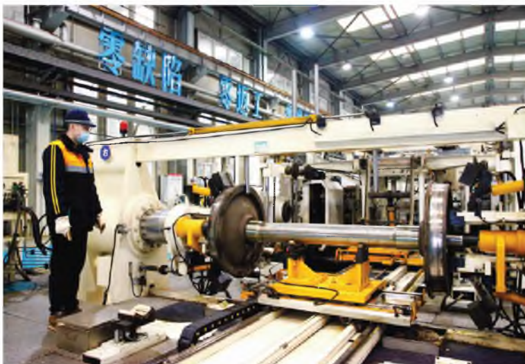
中国铁路西安局集团有限公司西安东车辆段职工进行车辆轮对压装作业

据了解,位于汉中市勉县周家山镇的大成电子科技有限公司自2月11日复工复产以来,200余名员工加紧生产,目前已完成600余万元的订单任务。