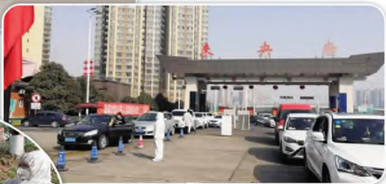
未央南收费站出口车道对通行车辆进行体温检测