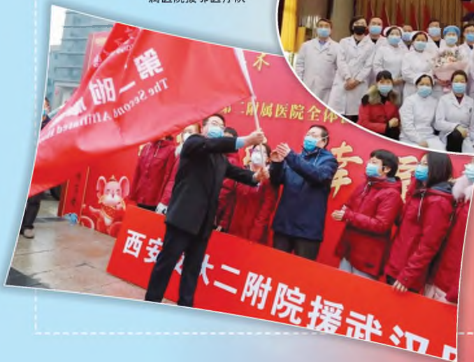
西安交通大学第二 附属医院援助湖北