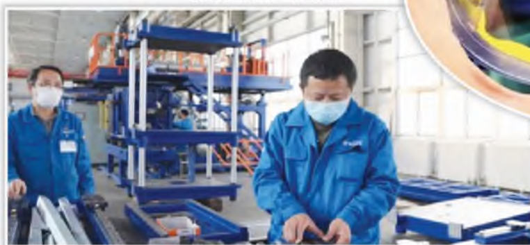
秦川机床工具集团 生产车间现场