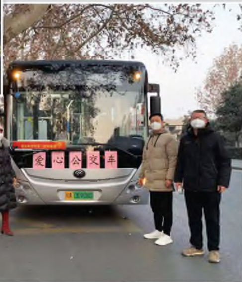
西安医学院第一附属医院接送职工上下班的爱心公交车

交大一附院工会发动离退休办、体检部、社区办、保卫部、职工健康管理中心等在全院教职工中开展疫情宣传和排查工作