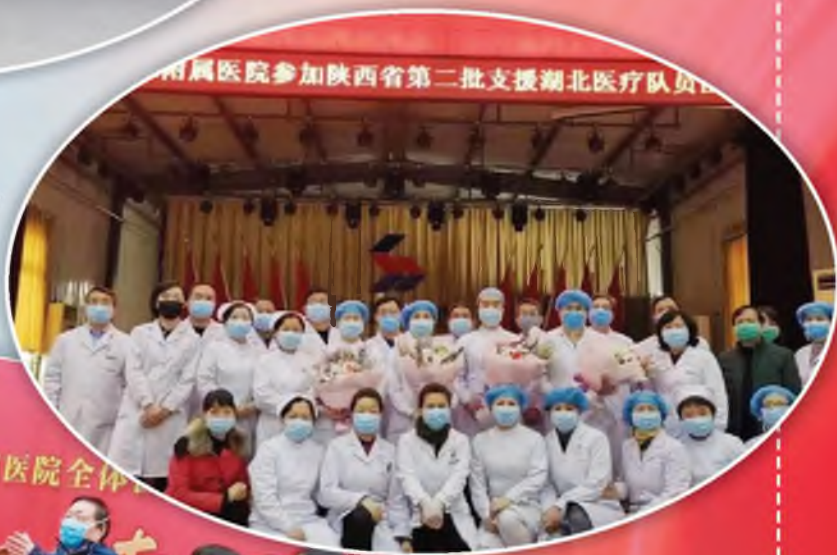
西安医学院第三附 属医院援鄂医疗队