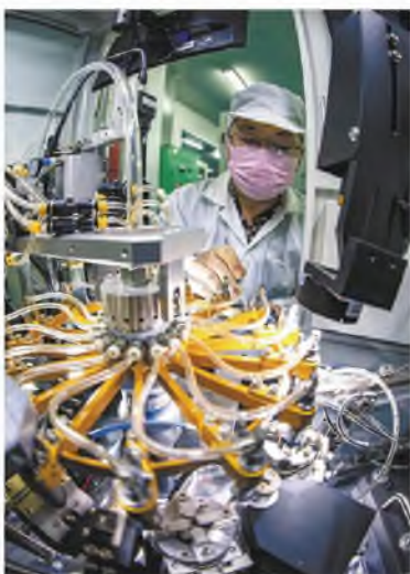
西京电气总公司陕西华经微电子股份有限公司自2月21日复工以来,已累计生产射频器件产品超过50万只