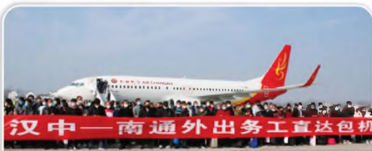
助力复工复产，长安航空复工定制包机从汉中起飞，运送员工返岗