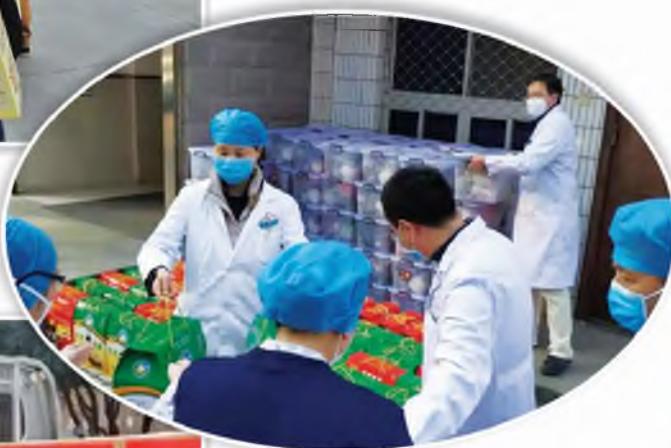
西北工业集团拨付 专款慰问医护人员