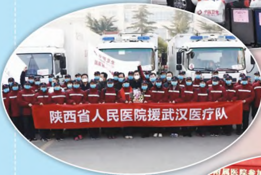
陕西省人民医 院援助武汉