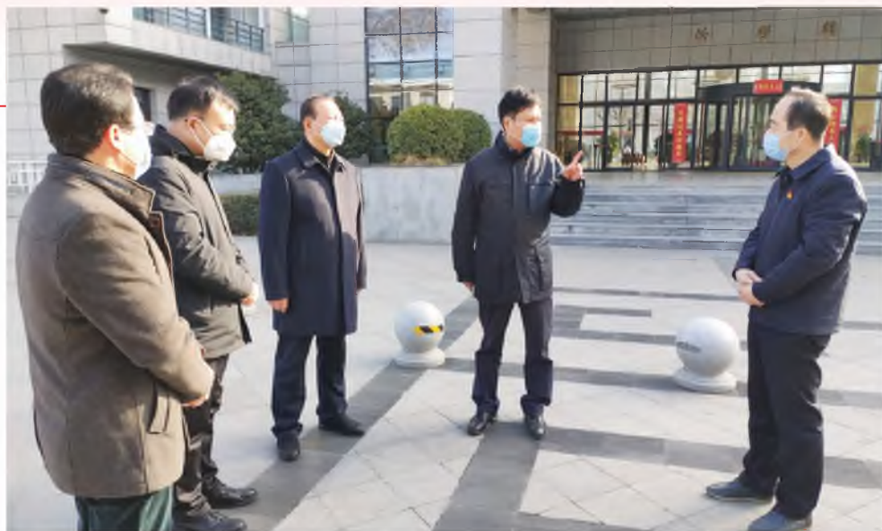
郭大为(右二)到省国防工会机关、省工人疗养院检查疫情防控工作

2月3日,省人大常委会副主任、省总工会主席郭大为到省国防工会机关、省工人疗养院检查疫情防控工作。他强调,打赢疫情防控阻击战是当前的一项重要政治任务,要切实把思想和行动统一到习近平总书记重要讲话和重要指示精神上来,增强“四个意识”、坚定“四个自信”、做到“两个维护”,全面贯彻“坚定信心、同舟共济、科学防治、精准施策”总体要求,落实好党中央、国务院的决策部署和省委、省政府及全总的防控工作要求,全力以赴坚决打赢疫情防控阻击战。