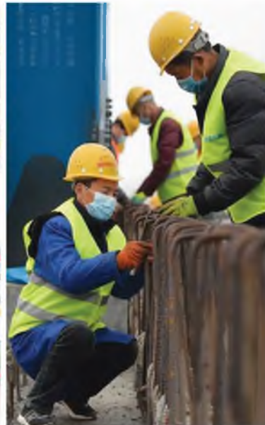
建设者在银西高铁漠谷河2号特大桥施工现场工作