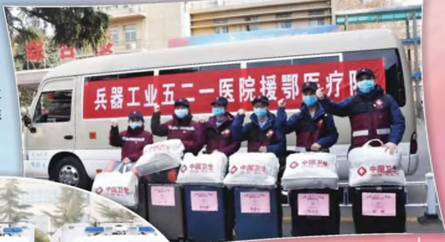
兵器工业五 二一医院援鄂医 疗队