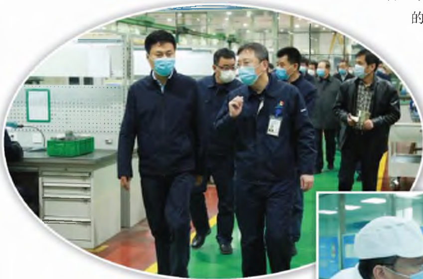
郭大为在中国航发西安动力控制 科技有限公司调研

手抓疫情防控，一手抓科研生产，做到“两手抓”“两不误”，目前职工复工率接近 100%、产能恢复 100%。郭大为说，各级工会特别是企业工会，越是在关键时刻越要体现“娘家人”的情怀，帮忙不添乱，围绕企业生产经营和职工关心的问题，大力开展劳动竞赛，切实关心职工生活，调动一切有利因素，把疫情造成的损失抢回来，把落下的任务追回来，奋力夺取疫情防控和生产科研“双胜利”。