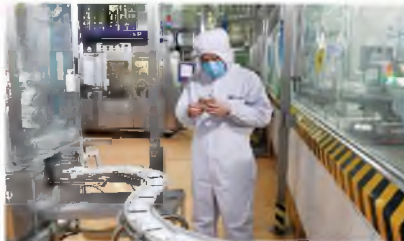
工人在西安银桥乳业集团液态奶生产线上工作