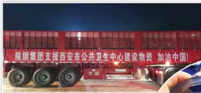
陕钢集团为陕西省西安市公共卫生中心建设项目场地运送钢材