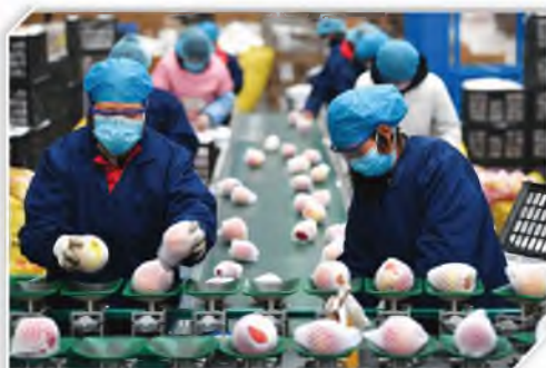
工作人员在分拣苹果 武功县一家电商企业

近日,武功县在做好新冠肺炎疫情防控工作前提下,成立复工复产领导小组,实行县镇村三级联动机制,帮助电商、物流企业解决招工、运输、销售等方面的实际问题,组织指导企业有序复工复产。