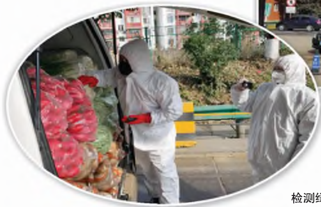
检测绿色通道车辆