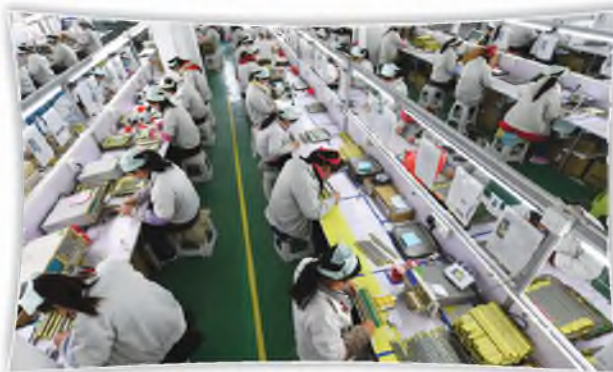
员工在电感器生产车间作业

据了解,位于汉中市勉县周家山镇的大成电子科技有限公司自2月11日复工复产以来,200余名员工加紧生产,目前已完成600余万元的订单任务。