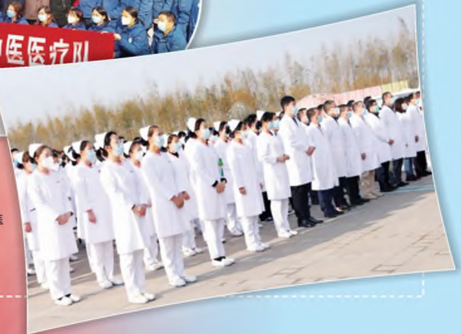
国际医学中心医 疗队援助湖北