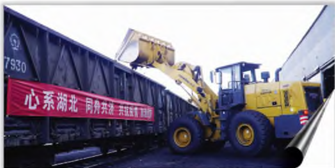
瑶曲车站职工进行电煤装车作业

疫情发生以来,为确保湖北地区各电厂电煤充足,中国铁路西安局集团有限公司铜川车务段多措并举,争取第一时间把电煤运送到目的地。据统计,1月20日以来,该段已向湖北地区发送电煤1712车,合计约11.1万吨。