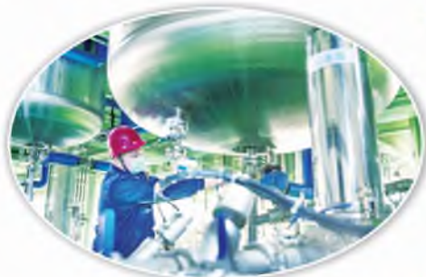
员工在电解液生产线作业

在新冠肺炎疫情防控期间,位于渭南市华州区的载元派尔森新能源科技有限公司在交通、物流不畅的情况下,始终坚持一边防疫、一边生产,确保国内外客户的原材料供给。