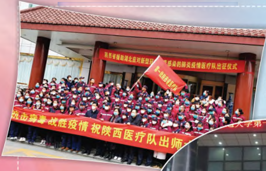
陕西省卫健委直属 第一批支援医疗队的 支援人员