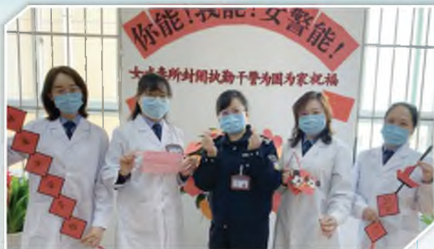
省戒毒所封闭执勤区的女警们在战疫一线开展祈愿送祝福活动