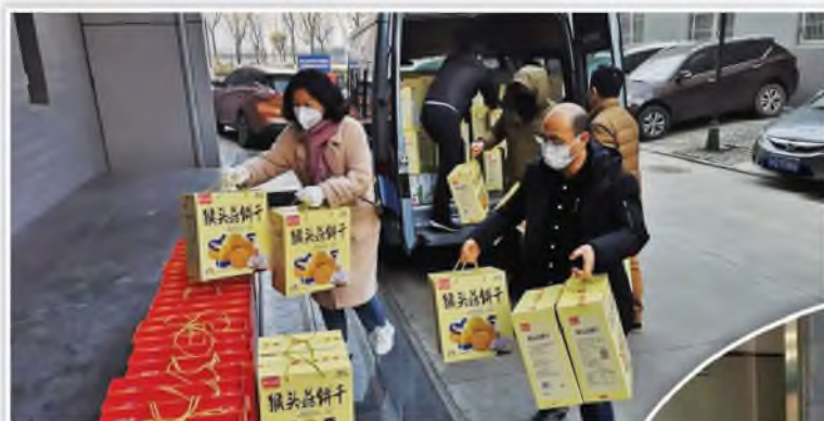
航天九院 16 所(7171 厂) 工会开展防控疫情慰问