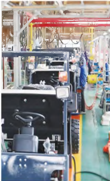
宝鸡合力叉车厂总装车间

近期，陕西制造业龙头企业之一的陕西汽车控股集团有限公司多措并举全力恢复重卡产能，服务工程建设和物流运输业。