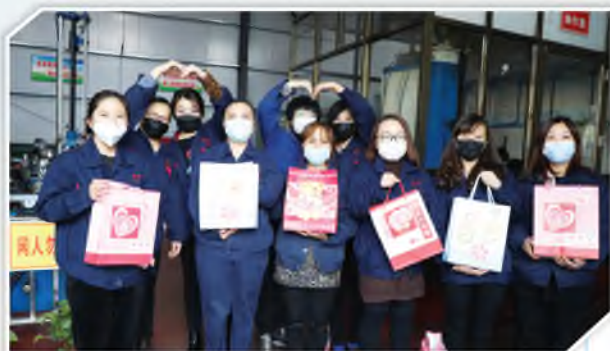
澄合煤矿分公司女职工为打赢疫情防控阻击战加油助力