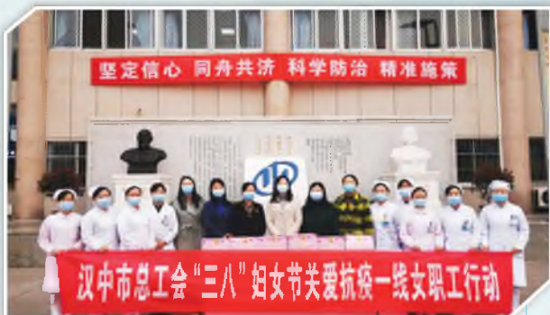
汉中市总工会为抗疫一线女职工送去节日慰问