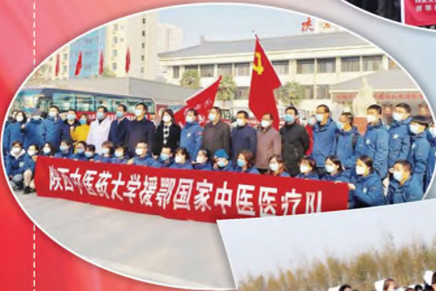
陕西中医药大学 援鄂中医医疗队