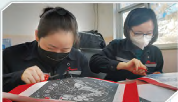
延长石油集团一线女职工用剪纸表达抗疫决心和信心