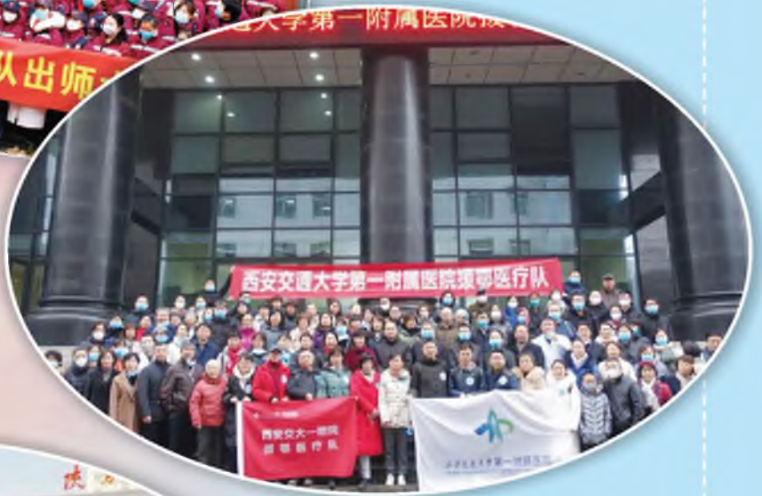
交大一附 院援鄂医疗队